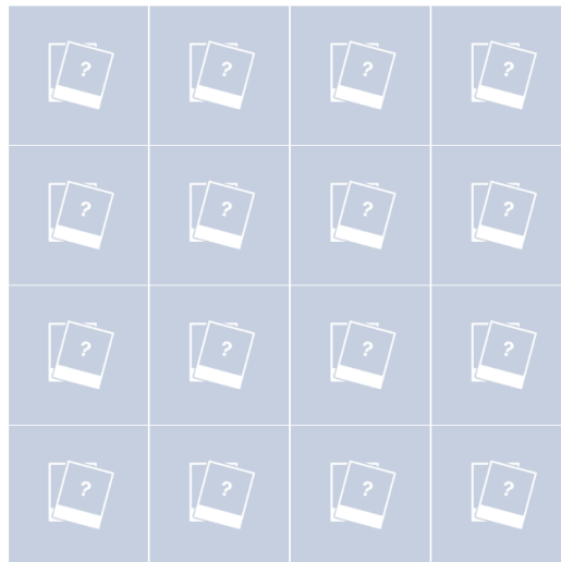
Slika 1. Početni izgled stranice

Na početku su sva polja zatvorena (emptyImage.png). Klikom na prvo zatvoreno polje treba prikazati sliku zastave koja se krije iza tog polja. Klikom na drugo zatvoreno polje takođe treba prikazati sliku zastave koja se krije iza tog polja i ukoliko su dva otvorena polja različita, nakon dve sekunde treba automatski zatvoriti polja. Ukoliko su dva otvorena polja ista, polja ostaju otvorena do kraja igre.